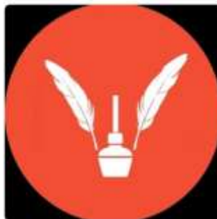
hrmeetup. © - The P... Michel Godart

Cliquez sur l'icône jaune de Storylific. Vous arrivez alors à l'endroit où vous pouvez voir